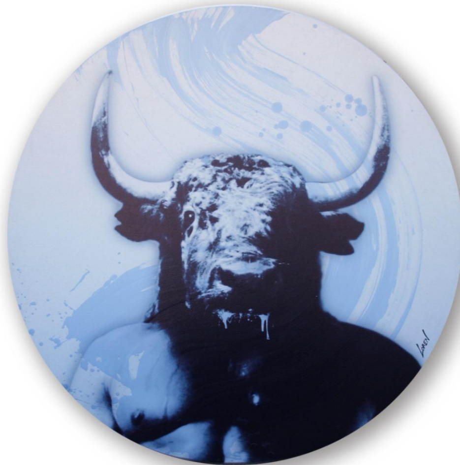
"MINOTAURO" Acrílico y técnica mixta sobre madera 60 cm diámetro

INAUGURACION "CIRCULO MERCANTIL", Viernes 8 de Marzo